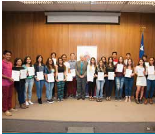
CEREMONIA DE BIENVENIDA HIJOS E HIJAS DEL PERSONAL ACADÉMICO Y DE ADMINISTRACIÓN Y SERVICIOS

Cada vez son más los padres y madres que confían en el trabajo que la Oficina de Beneficios a las Personas desarrolla cada verano en conjunto con la Fundación La Semilla. Este 2017 más de 40 niños, niñas y jóvenes disfrutaron de las actividades al aire libre que se desarrollaron en la comuna de Hijuelas y Concón. El campamento de verano, enmarcado dentro del área de “Conciliación, Trabajo y Familia”, da cuenta de la importancia que la Universidad da al rol de los padres y madres, el cual se conjuga con el trabajo desarrollado en cada uno de los puestos de trabajo.