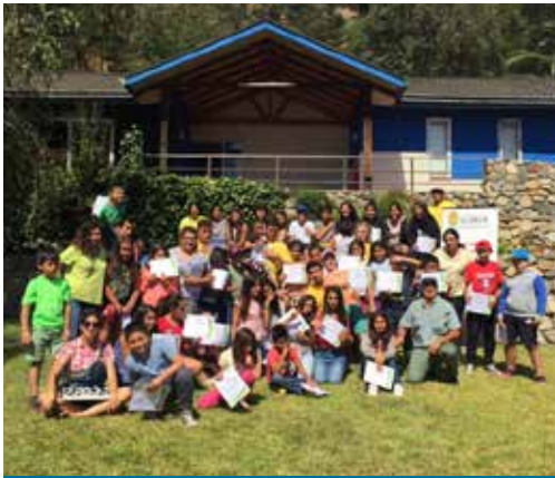
CAMPAMENTOS DE VERANO

Cada vez son más los padres y madres que confían en el trabajo que la Oficina de Beneficios a las Personas desarrolla cada verano en conjunto con la Fundación La Semilla. Este 2017 más de 40 niños, niñas y jóvenes disfrutaron de las actividades al aire libre que se desarrollaron en la comuna de Hijuelas y Concón. El campamento de verano, enmarcado dentro del área de “Conciliación, Trabajo y Familia”, da cuenta de la importancia que la Universidad da al rol de los padres y madres, el cual se conjuga con el trabajo desarrollado en cada uno de los puestos de trabajo.