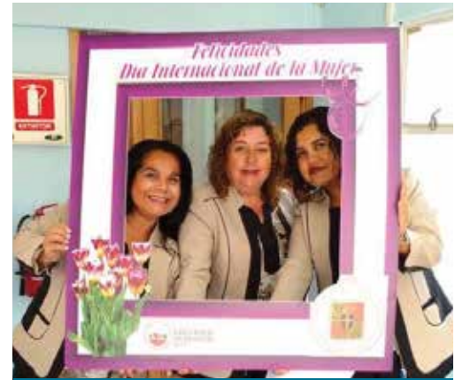
CONMEMORACIÓN DÍA INTERNACIONAL DE LA MUJER:

Los primeros días de marzo nuestra Universidad se llena de orgullo con la entrega de becas a los hijos de su personal, beca que cubre el 100% del arancel, lo que representa un gran apoyo para los nuevos universitarios y sus familias. Este acto tiene un valor especial para la comunidad universitaria, pues representa un beneficio que es inédito en Chile para una institución de educación superior, lo que se relaciona con la vocación pública de la PUCV y el especial cuidado por quienes aquí trabajan y sus familias.