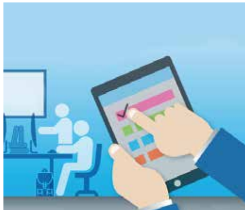
FINALIZA PROCESO DE EVALUACIÓN DE DESEMPEÑO

Este año la celebración tuvo un carácter especial, llevando a la comunidad PUCV el trabajo desarrollado por la Corporación Tukuypaj, cuya misión es proporcionar una respuesta alternativa y rehabilitadora a la problemática social de las personas en situación de discapacidad intelectual y motora en la V Región, promoviendo la vida independiente y participativa en la esfera social, económica y cultural, conforme a las reales y potenciales capacidades de cada uno.