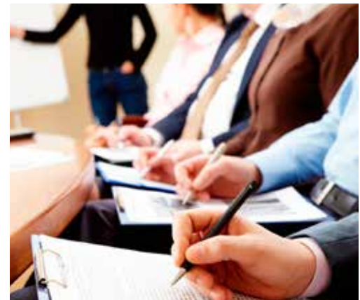
ENCUESTA DE NECESIDADES DE CAPACITACIÓN