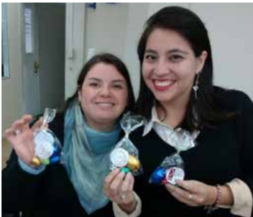
PASCUA DE RESURRECCIÓN

En esta jornada aprovechamos de reconocer y agradecer la labor de cada una de las mujeres que en las salas de clases, en la investigación, en la creación y en la administración, entregan, muchas veces, en doble jornada - en la Universidad y en sus hogares- un aporte que enriquece el quehacer en nuestros espacios de trabajo. Este día nos recuerda que tenemos que avanzar en el logro de mayores espacios de igualdad para las mujeres y tenemos que trabajar con empeño en dar pasos en ese sentido.